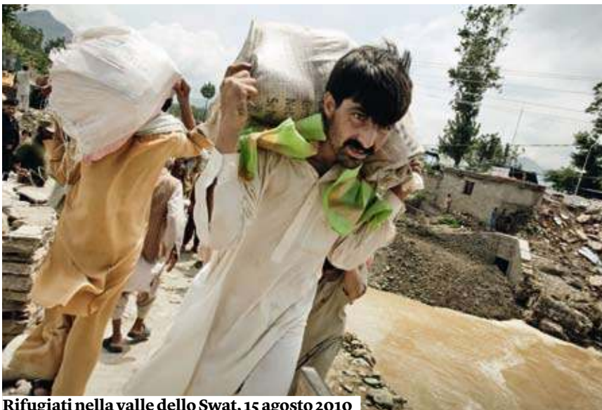
Rifugiati nella valle dello Swat, 15 agosto 2010

la verità e la riconciliazione in Sierra Leone (Trc, assistita dall'Onu) ha pubblicato un rapporto in cui è descritto un incontro, avvenuto alla fine degli anni novanta, tra i ribelli e i soldati governativi. Il tema centrale era la comune necessità di attirare l'attenzione della comunità internazionale. Era evidente a tutti che le mutilazioni avevano ottenuto un'attenzione da parte dei giorna-