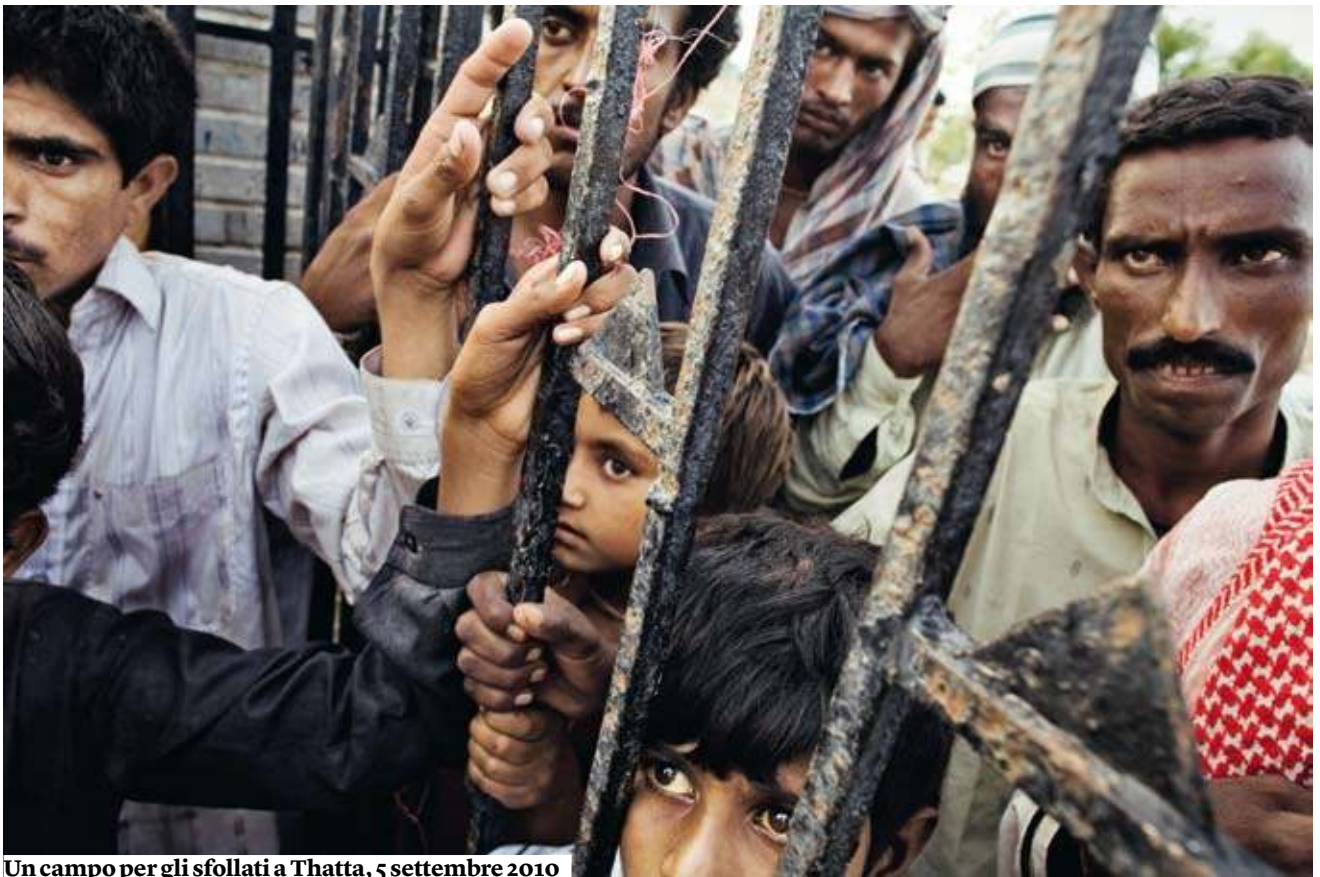
Un campo per gli sfollati a Thatta, 5 settembre 2010