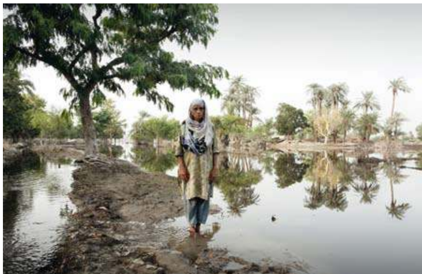
Mehmood Kot, 29 agosto 2010. Una donna che ha perso la casa nelle alluvioni

Nel maggio del 1996, nella cittadina di Kitchanga, nella provincia del Nord Kivu (nella Repubblica Democratica del Congo, Rdc, che fino al 1997 si è chiamata Zaire), trascorsi la notte in un'aula scolastica che era stata adibita a sala operatoria dai chirurghi dalla sezione olandese di Medici senza frontiere (Msf). Pochi giorni prima una banda proveniente dai campi profughi allestiti dalle Nazioni Unite per gli hutu ruandesi, e controllati dagli stessi respon-